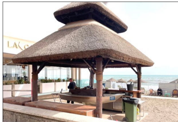
Imagen de una barca de espetos. Abajo, caseta de vigilancia en las playas.