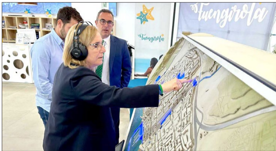
Las maquetas digitales e inteligentes son accesibles para personas invidentes.

En este sentido, se trata de maquetas que se pueden tocar y que están adaptadas para que todas las personas con cualquier tipo de diversidad sensorial puedan apreciarlas mediante su observación e interacción tridimensional, mejorando la experiencia del visitante. Todas cuentan con una pantalla táctil –situada a una altura por la que cualquier persona con movilidad reducida puede