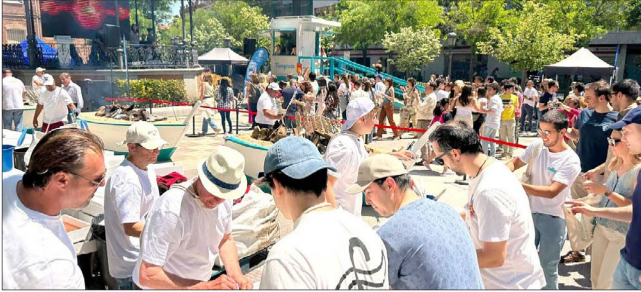
Aspecto de la plaza madrileña de Chamberí durante el acto promocional celebrado el pasado sábado.