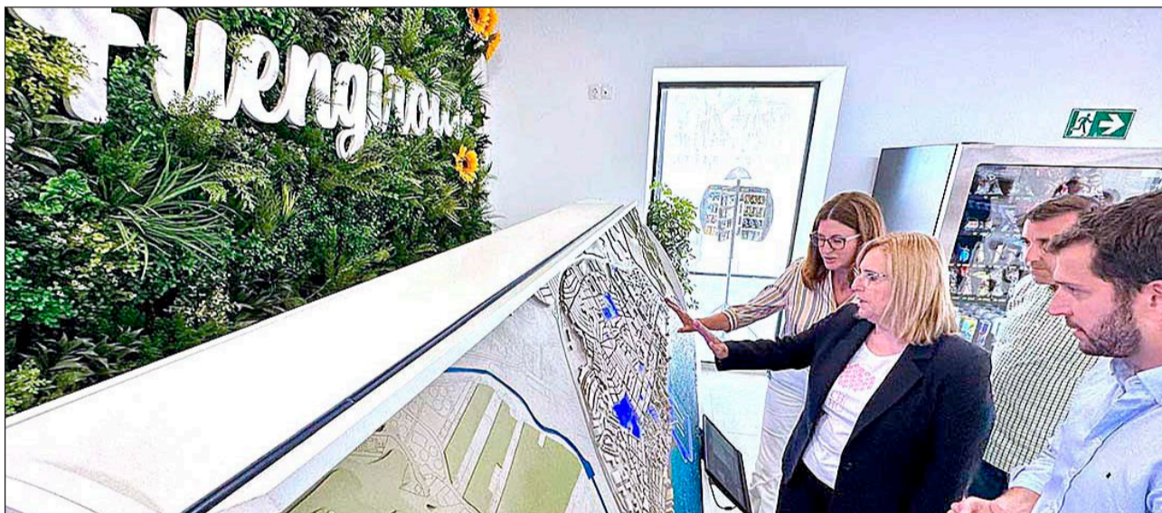
Estos dispositivos ya están en servicio en la Oficina de Turismo, así como en el Castillo Sohail y en el yacimiento romano de la Finca del Secretario.