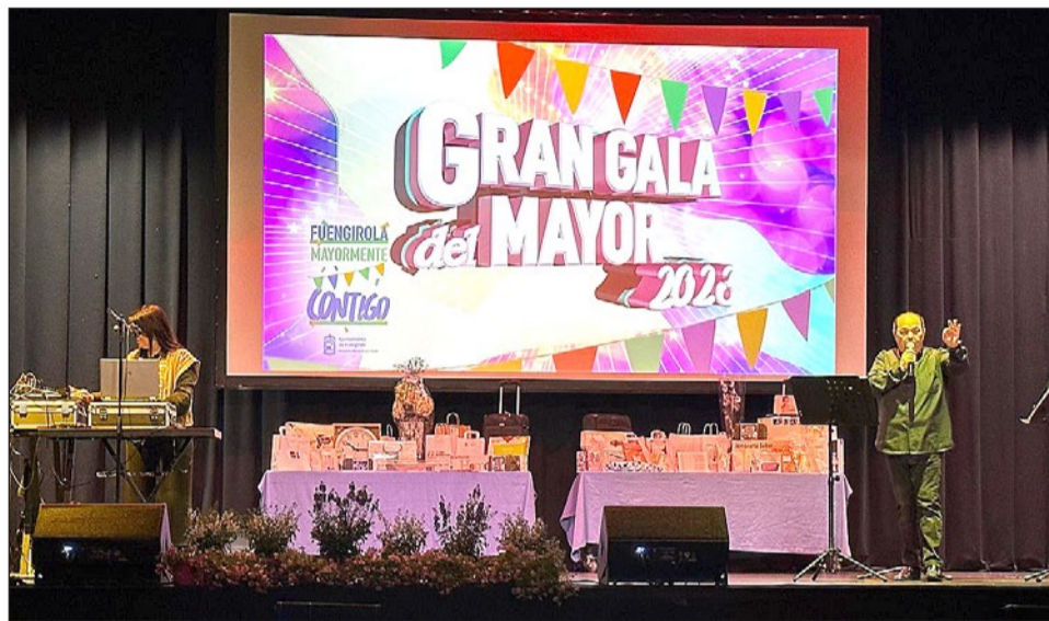
Imagen de una edición anterior de la Gala del Mayor.

La cita tendrá lugar el próximo 22 de mayo, a partir de las 18.30 horas, y contará, entre otras actividades, con actuaciones musicales, sorteos y photocall