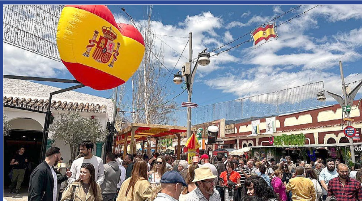
La Feria Internacional de los Países reúne en esta edición a representantes de más de una treintena de naciones