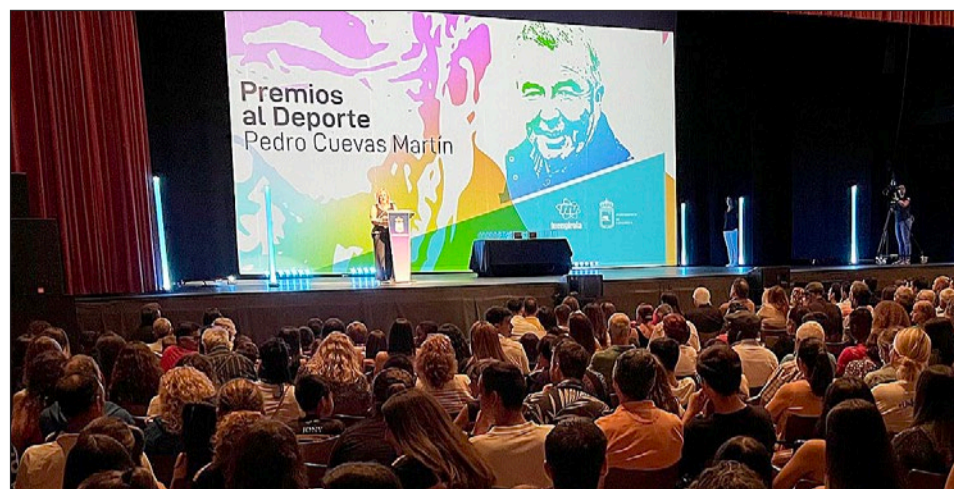
Imagen de una edición anterior de la Gala de los Premios "Pedro Cuevas Martín".

"Presentamos una nueva edición de la Gala del