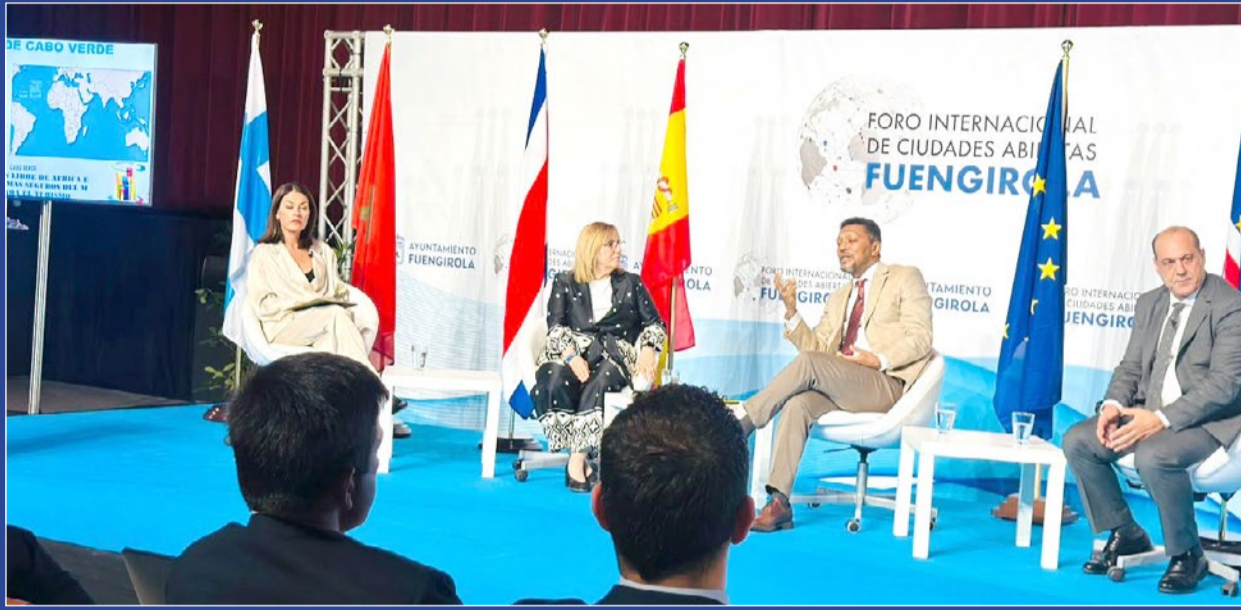
El éxito de la primera edición ha servido de antesala a la Feria Internacional de los Países.