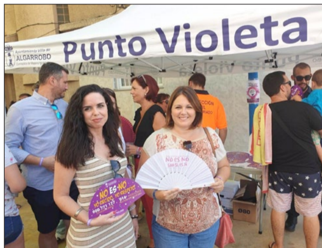
Punto Violeta de la Feria de Mezquitilla.

Igualmente, si se detecta algún caso, se realiza un acompañamiento a la víctima, además de ofrecer