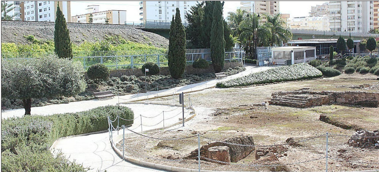
El recorrido previsto para el próximo 19 de marzo incluye una visita al yacimiento arqueológico Finca del Secretario.