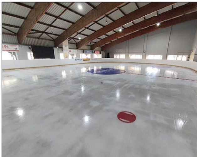
La competición se celebrará en la pista de hielo del Palacio de Deportes.

En rueda de prensa, Carretero ha señalado que este será "un gran espectáculo, una emocionante competición de patinaje sobre hielo internacional, que contará con la participación de patinadores de hasta 12 países como Inglaterra, Turquía, Chi-