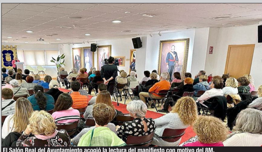
El Salón Real del Ayuntamiento acogió la lectura del manifiesto con motivo del 8M.