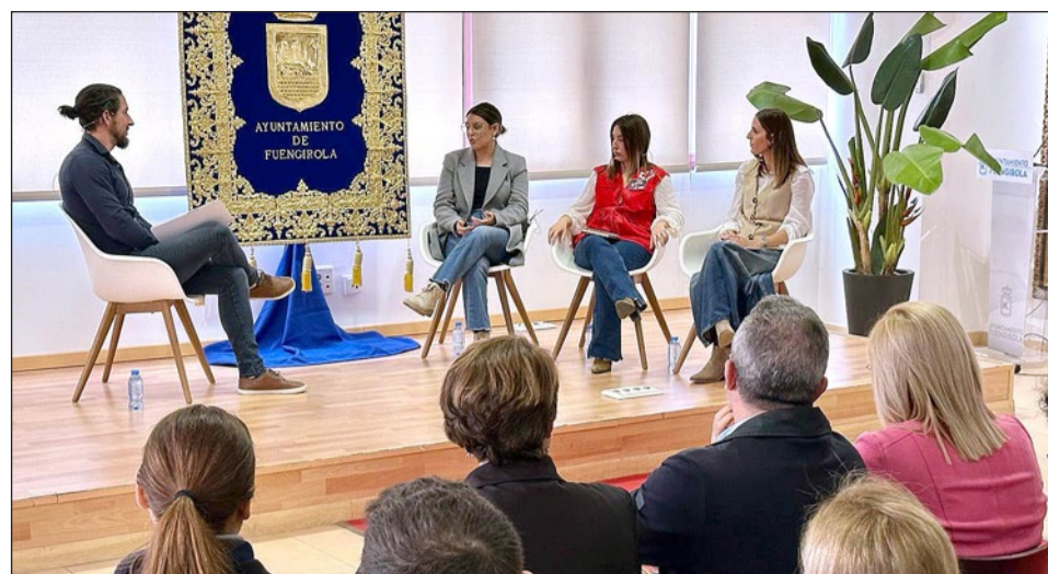
Un momento de la mesa redonda sobre liderazgo femenino en el tercer sector celebrada tras la lectura del manifiesto.

En el manifiesto se recuerda que “a lo largo de la historia se ha teni-