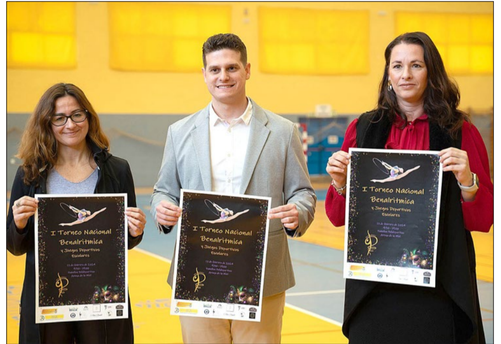
El edil de Deportes junto a representantes de Benalrítica, club organizador del evento.

nuestro tiempo de forma desinteresada para que nuestras hijas puedan practicar este hermoso y difícil deporte, hasta hora mayoritariamente femenino, que enseña valores tan importantes en la vida como son el esfuerzo, la disciplina, el afán de superación, el compañerismo, el respeto y el trabajo en equipo, entre otros", señalan.