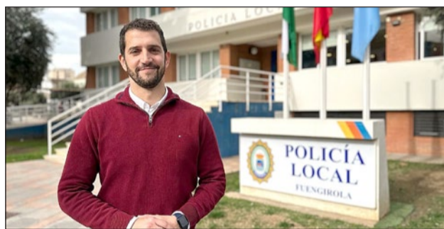
El edil de Seguridad Ciudadana ofreció datos de las actuaciones realizadas.

“Cuando hablamos de Policía Local se nos vienen