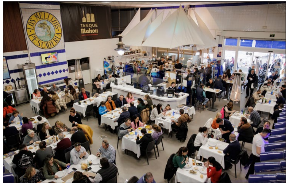
Imagen de la "Pescadería Los Mellizos" en Arroyo de la Miel.

zos Fuengirola" y "Los Mellizos Marbella" ofrecen en estas Jornadas la comentada carta especial con 15 variedades de arroces y paellas, además de otros platos, también a precios de oferta.