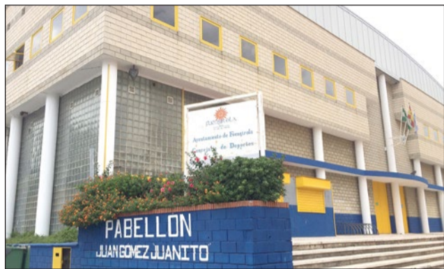
La entrada al pabellón "Juanito" para presenciar este evento es gratuita.

Tendrá lugar mañana sábado y el domingo en las instalaciones del pabellón Juan Gómez "Juanito", en horario de 09.00 a 18.00 horas