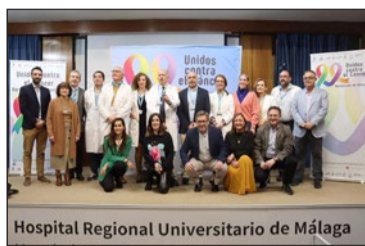
Hospital Regional Universitario de Málaga

DÍA CONTRA EL CÁNCER INFANTIL | El Hospital Materno Infantil, junto a la Agrupación de Desarrollo Unidos Contra el Cáncer, conmemoró ayer el Día Internacional contra el Cáncer Infantil mediante la lectura de un manifiesto compartido por una representante de la asociación, personal de enfermería, un facultativo de Pediatría y Hematología, y un paciente del centro.