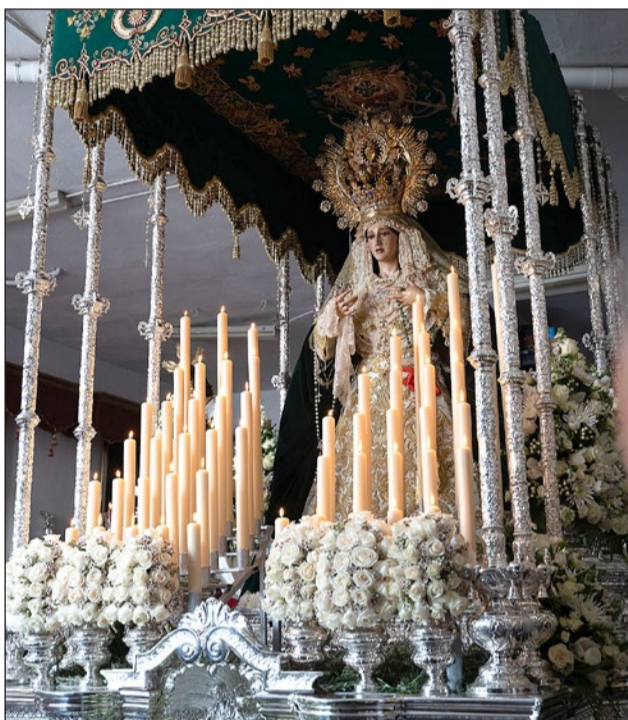
Cautivo y María de la Esperanza.