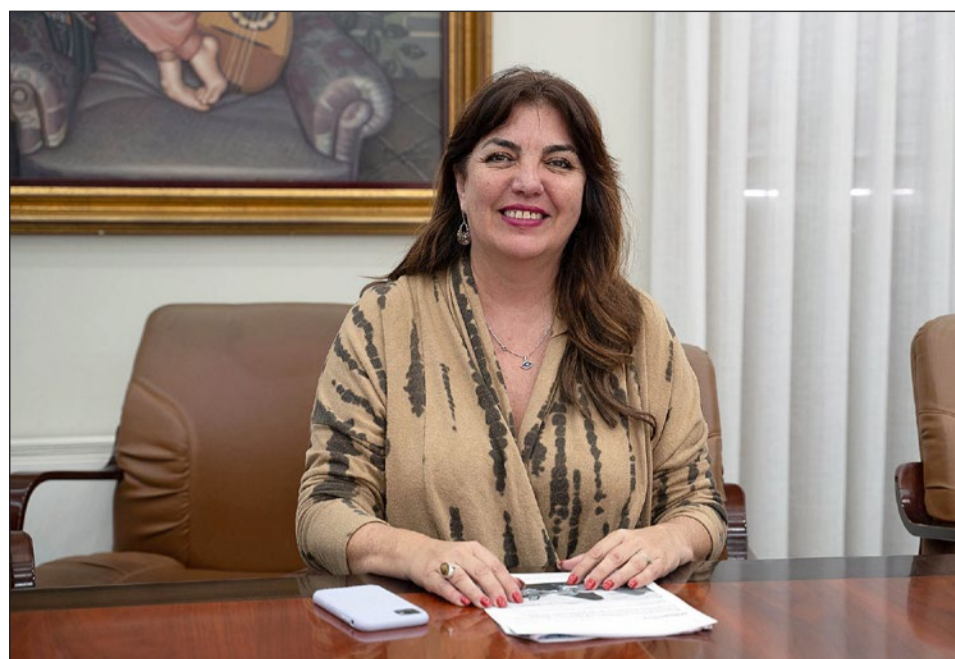
Presi Aguilera avanzó que se trabaja en un Plan Estratégico junto a Turismo y Planificación Costa del Sol.

Aguilera ha explicado que el nuevo equipo de gobierno está trabajando con un plan estratégico para los próximos años con Turismo y Planificación Costa del Sol y otros expertos. La edil ha destacado también las diversas acciones promocionales que se han llevado a las ferias turísticas y en las que el Puerto Deportivo ha vuelto a recuperar su papel protagonista con un amplio paquete de inversiones previsto, así como su Plan de Dinamización, la amplia oferta hotelera de la que dispone el municipio, ocio y gastronomía, a la que se suman tres núcleos bien diferenciados y un destino único deportivo capaz de albergar grandes eventos como la Copa del Rey y Copa de la Reina Iberdrola 2024, que tan buen resultado ha dado a mediados de marzo.