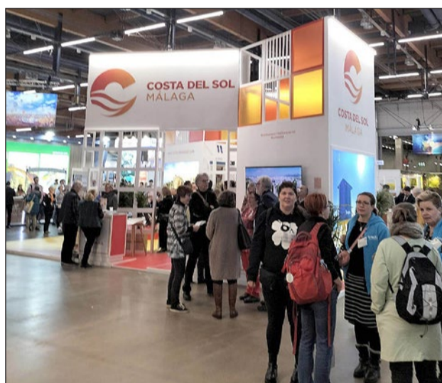
La feria de turismo MATKA.

La edil de Turismo ha ensalzado "el magnífico trabajo" que está hacien-