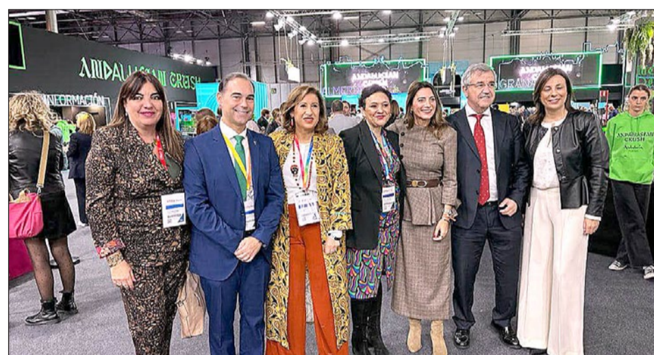
Benalmádena, presente en la última edición de FITUR.