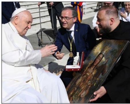
imagen de Santa María de la Victoria con el niño en brazos y sosteniendo, en lugar del pajarito que porta la escultura original, un ramillete de flores. De fondo, la imagen de la visión de San Francisco de Paula, fundador de los Mínimos.