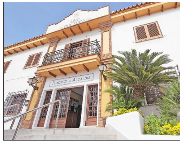
La primera sesión, el 27 de marzo, se celebrará en la Casa de la Cultura.

La reunión del grupo de Arroyo de la Miel tendrá lugar el cuarto jueves de cada mes en el Aula Telemática del edificio Ovoide,