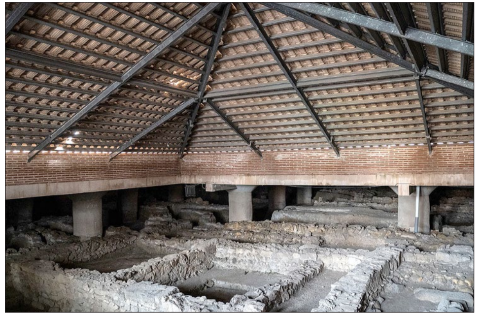
El alcalde ha pedido que se estudie la redacción de un proyecto museológico junto a un equipo de expertos de relieve para la redacción de un proyecto básico y de ejecución de puesta en valor.