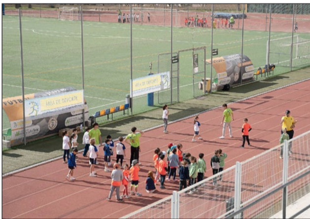
Las jornadas se desarrollan en el Polideportivo Arroyo de la Miel.