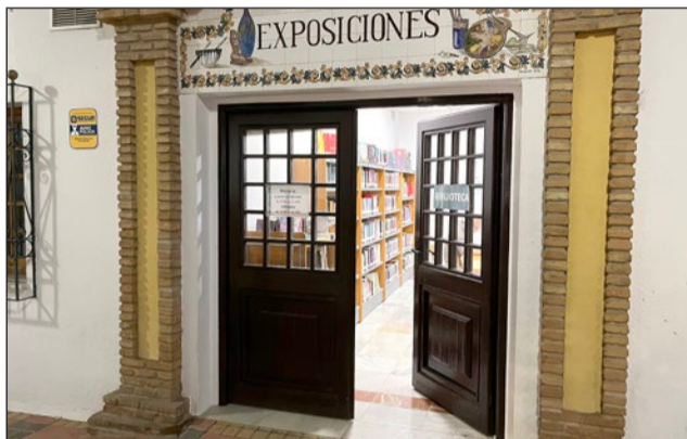
La biblioteca en la Casa de la Cultura registra 3.500 usuarios.

Desde el pasado 9 de enero, fecha en la que se abrieron las salas de estudio en el edificio Innova, colegio La Paloma, Polideportivo Ramón Rico y edificio Ovoide, y hasta finalizar febrero, más de 5.800 personas han estudiado en estos espa-