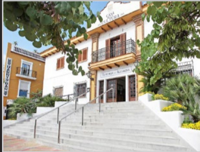
El día 12 de marzo en la Casa de la Cultura.

La iniciativa, que se desarrollará la próxima semana, concretamente