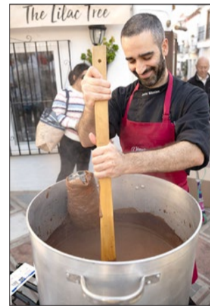
Navidad gigante. En esta ocasión, se elaboró un corazón gigante

Muchos fueron los vecinos y visitantes golosos que se acercaron hasta allí para degustar un dulce que sin duda logró el éxito de convocatoria de su antecesor, el tronco de