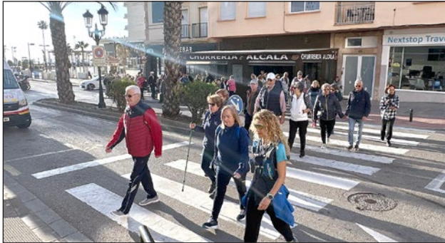
Imagen de una actividad de senderismo realizada anteriormente.

La iniciativa tendrá lugar el próximo sábado 24 de febrero, a partir de las 9.30 horas, con una sesión que se desarrollará por la zona centro de la ciudad y que tendrá como punto de