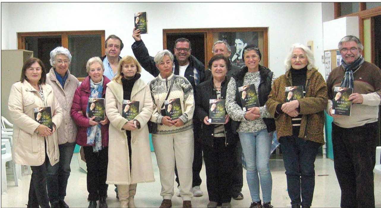
Imagen de los miembros del club de lectura en su cita del pasado mes de enero.