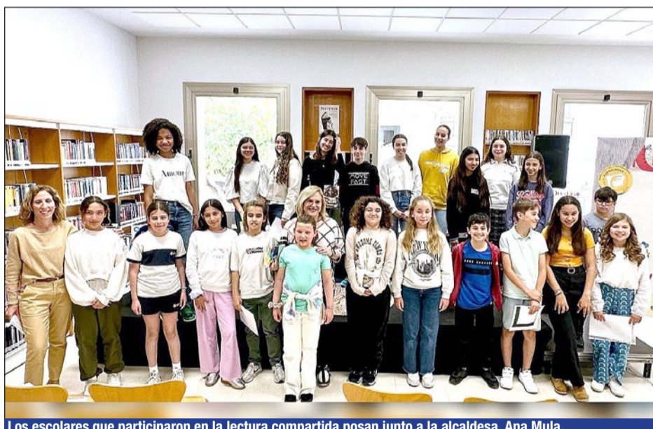
Los escolares que participaron en la lectura compartida posan junto a la alcaldesa, Ana Mula.

Fuengirola celebró ayer el Día del Libro con una lectura conjunta en la biblioteca Miguel de Cervantes del parque del Sol. La alcaldesa, Ana Mula, junto a varios escolares de diferentes centros de la ciudad, participó un año más en este acto para fomentar el hábito de la lectura entre los niños y jóvenes de la ciudad.