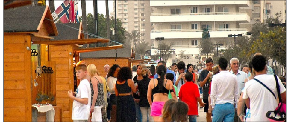
Imagen de una edición anterior del Mercado de Artesanía.

Del 14 de junio al 15 de septiembre un total de 10 cabañas de madera ofrecerán todo tipo de productos manufacturados en el tramo entre el arroyo Real y el monumento a La Peseta