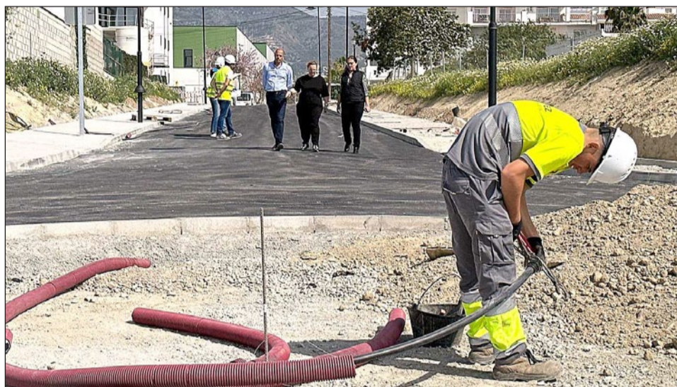
Un operario trabaja en las obras de calle Los Vecinos.

La creación y puesta en marcha del Centro de Salud llevaba aparejada la adecuación urbanística de este sector. Las infraestructuras que teníamos hasta ahora eran insuficientes para la afluencia de personas y tráfico que se espera en una instalación de este tipo. Por eso, nos comprometimos a dotar a este