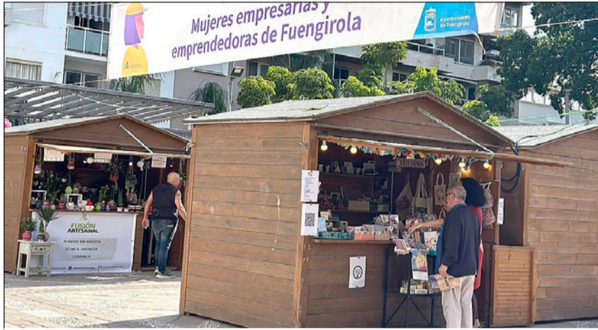
Imagen de una edición anterior de la Feria de Mujeres Empresarias y Emprendedoras de Fuengirola.

• Este evento tiene como objetivo dar a conocer las iniciativas y negocios que están presentes en el municipio y que están regentados por mujeres