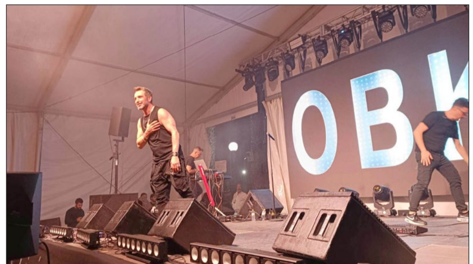
Más de 5.000 personas disfrutaron el pasado fin de semana del 'Only Fest'.