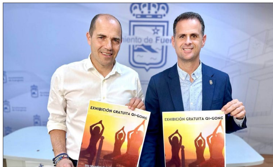
Los ediles de Deportes y Ecología Urbana informaron ayer de esta nueva actividad.

En este sentido, el edil explicó que “el Qi Gong es muy similar al Tai Chi y nos ayuda a la meditación, a la respiración, a estar en contacto con la naturaleza... Hemos querido aunar esas acciones de la mano del Área de Ecología Urbana para conmemorar el Día Mun-