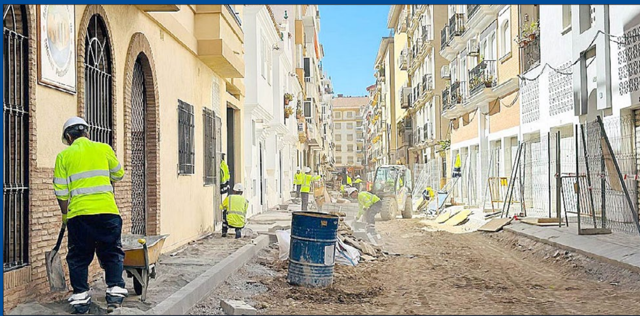
La actuación implica la sustitución de todas las infraestructuras soterradas, la pavimentación y la iluminación.