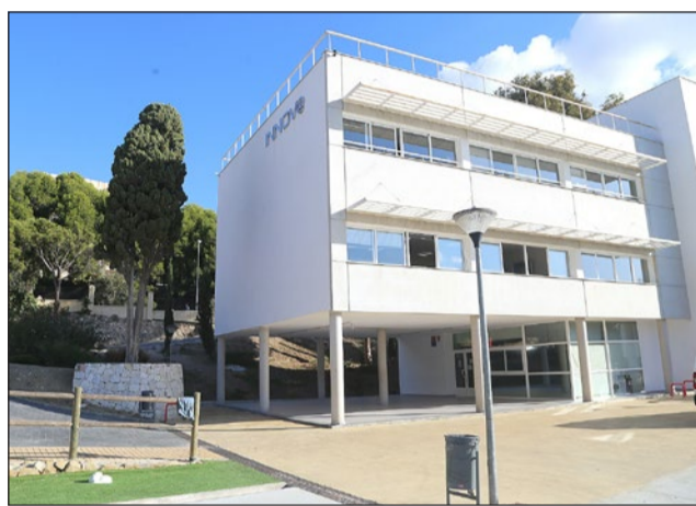
El programa se desarrollará en el Edificio Innova.

Los requisitos para participar pasan por tener entre 16 y 29 años, estar en situación de desem-