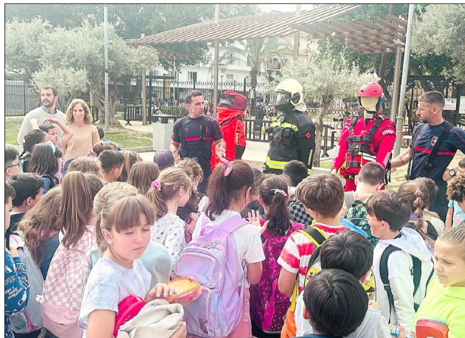
Centenares de alumnos participaron en la Semana de Prevención de Incendios.

“Comenzamos el último trimestre del año, no sin antes repasar todas aquellas actividades que hemos tenido durante el segundo trimestre y que han podido disfrutar más de 9.500 niños. Una cifra muy abundante teniendo en cuenta que el trimestre comenzó después de la Navidad y que finalizó el día 22 de marzo, con lo cual no ha sido muy