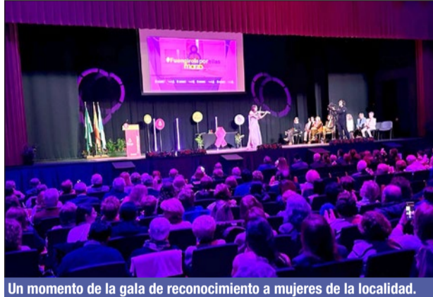
Un momento de la gala de reconocimiento a mujeres de la localidad.

En este sentido, la edil indicó que "las personas que se han podido beneficiar de la veintena de actividades que se han desarrollado han sido un total de 4.340, de las cua-