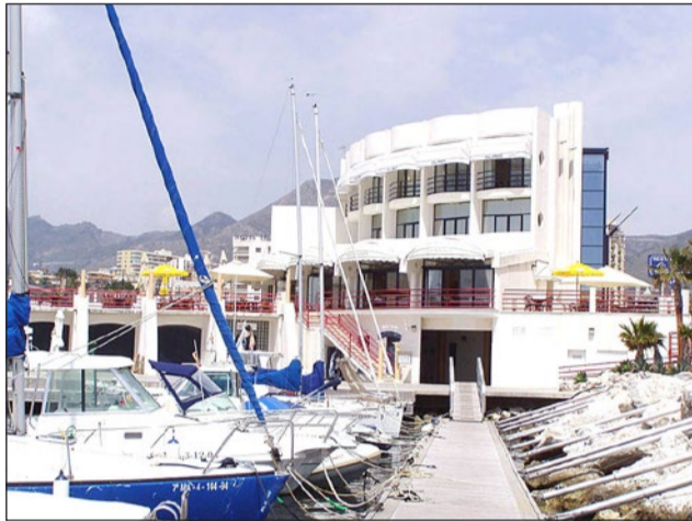
El Centro Náutico del Puerto acogerá la entrega de premios.

El evento se realizará en la piscina del Palacio de Deportes de Benalmádena el domingo día 7 de abril de 8.30 a 14.00 horas con la inscripción prevista para el día antes, sábado. La piscina cuenta con una longitud de 25