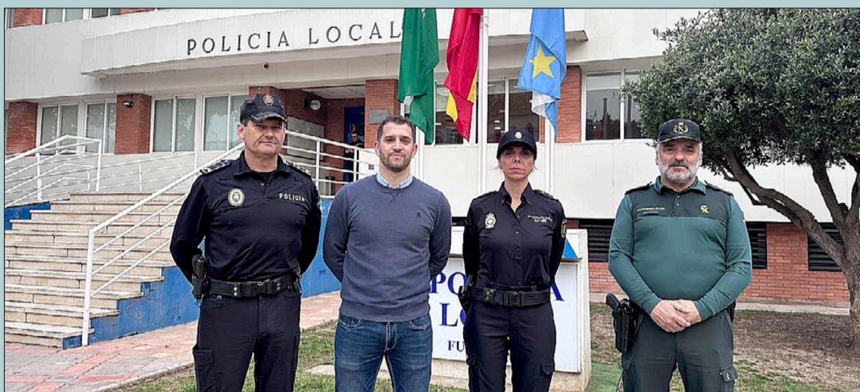
El edil de Seguridad y responsables de los distintos Cuerpos y Fuerzas de Seguridad informaron ayer del dispositivo policial previsto para hoy.