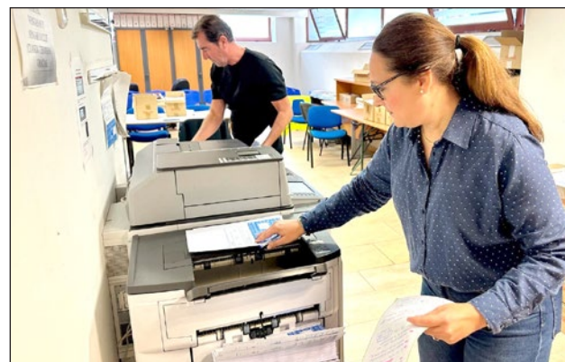
La edil recoge uno de los triptícos que informan del calendario de pagos.

Acercar la administración a los vecinos es una de las prioridades del equipo de Gobierno municipal y para ello, Bravo ha señalado que “intentamos siempre facilitar las formas de pago ofreciendo distin-