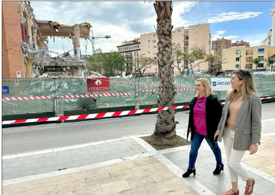
La alcaldesa y la edil de Infraestructuras durante la visita a las obras de transformación de Mercacentro.

Asimismo, el planteamiento arquitectónico establece que estará distribuido en varias plantas: un sótano de aparcamiento para clientes, así como otro para carga y descarga de camiones; la planta baja, que tendrá tres grandes accesos y donde se distribuirán los 39 puestos de venta del mercado, así como un vestíbulo central cubierto con