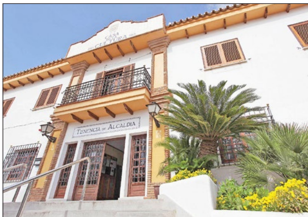
La Casa de la Cultura acogerá este jueves la proyección de "La Ballena".

Inaugura mañana esta estación de las flores "La Ballena" de Darren Aro-