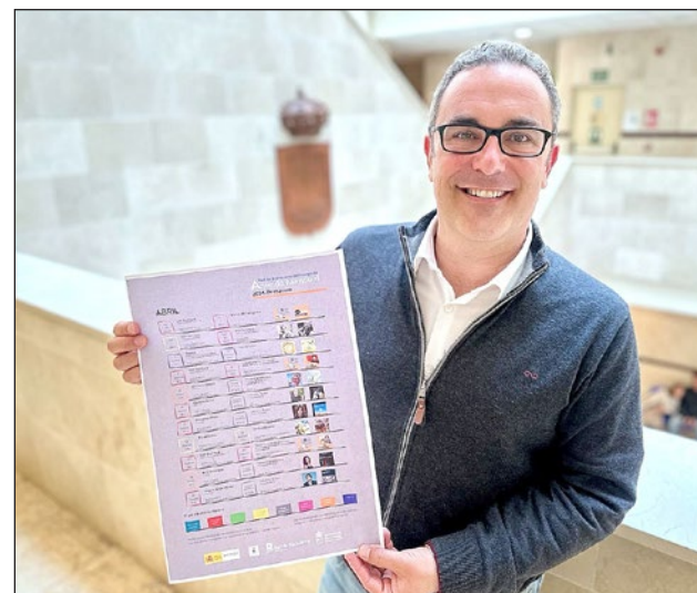
El edil de Cultura informo de las actividades de la Red de Bibliotecas para abril.

Además, el proyecto de creación literaria 'Lab Escritura' cerrará mañana miércoles 3 de abril su proceso de inscripción