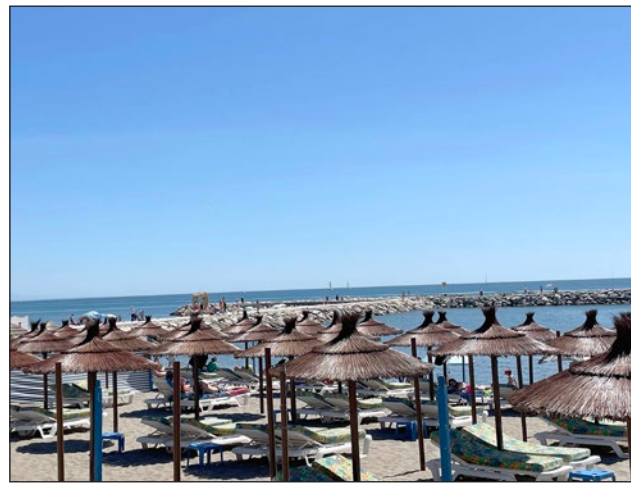
Todas las pruebas partirán desde la playa de San Francisco.

Por su parte, entre las 10.00 y las 11.00 horas, comenzarán las pruebas más accesibles al resto de nadadores. En este sentido, la previsión que maneja la organización,