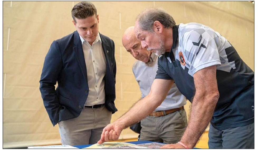
SE CELEBRARÁ EL 26 DE ABRIL EN EL PARQUE AL-BAYTAR