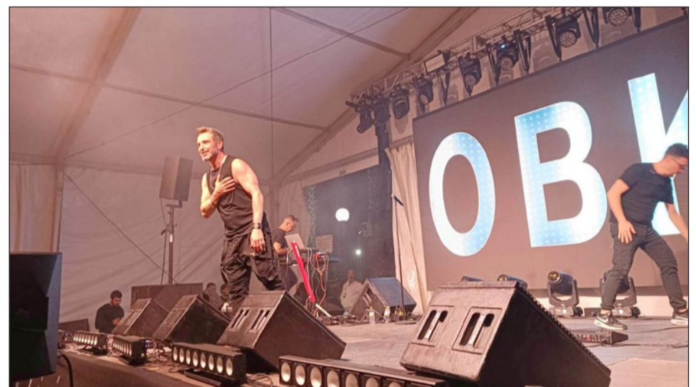
Más de 5.000 personas disfrutaron el pasado fin de semana del 'Only Fest'.