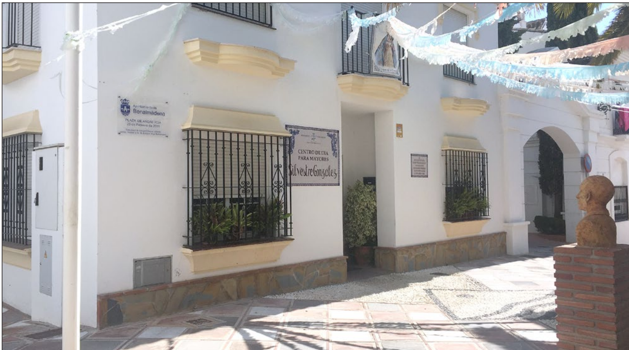
La charla se celebrará en el Centro de Participación Activa "Silvestre González".