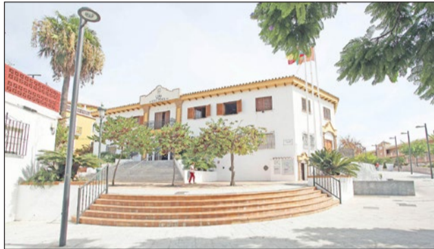
Servicios Operativos se ocupará también del granito de la fuente de la Casa de la Cultura.

Desde el área, señalan que los informes técnicos confirman que las fuentes que ahora mismo están en funcionamiento por el municipio son aquellas que se mantienen debido a que apenas sufren pérdidas de evaporación ni de otro motivo tras las labo-