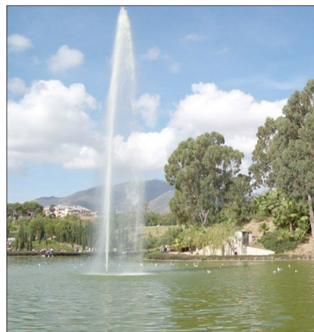
Benalmádena riega el parque de La Paloma con agua regenerada.

"Queremos trasladar a la sociedad benalmadense que este Ayuntamiento, al igual que los municipios vecinos, está a la espera de la reunión del comi-