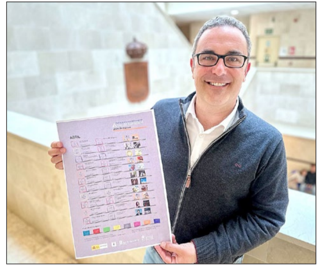
El edil de Cultura informo de las actividades de la Red de Bibliotecas para abril.

Además, el proyecto de creación literaria 'Lab Escritura' cerrará mañana miércoles 3 de abril su proceso de inscripción