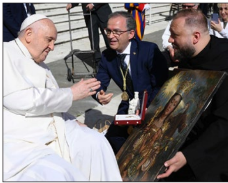
imagen de Santa María de la Victoria con el niño en brazos y sosteniendo, en lugar del pajarito que porta la escultura original, un ramillete de flores. De fondo, la imagen de la visión de San Francisco de Paula, fundador de los Mínimos.